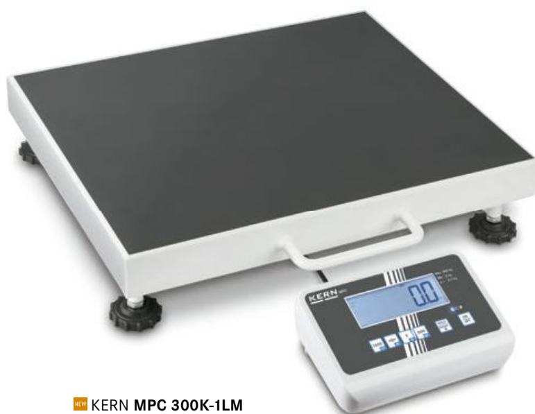
NEW KERN MPC 300K-1LM