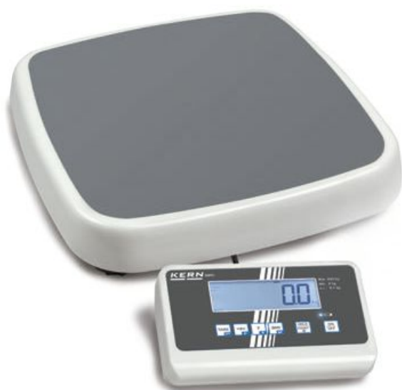
KERN MPC 250K100M, NEW MPC 300K-1M