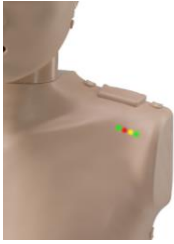
Monitor luminoso en torso adulto y pediátrico