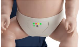
Monitor luminoso en maniquí neonatal

El monitor luminoso para la frecuencia de las compresiones torácicas de los maniqués y torsos de RCP de la firma Prestan® cumple con las últimas Recomendaciones de Resucitación CPR & ECC e indica al alumno cuando llega al rango adecuado de compresiones, así como cuando excede en la velocidad de las compresiones.